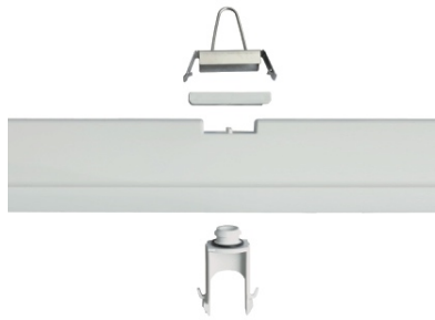
Befestigungssystem Deckenmontage | Abhängung