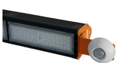
Seitenansicht mit Sensor

Die komplette Entwicklung und Produktion dieses LED-Strahlers erfolgt in Deutschland. Dieses Produkt trägt auch zu recht das Prädikat „Made in Germany“ und stellt kurze Beschaffungszeiten sicher.