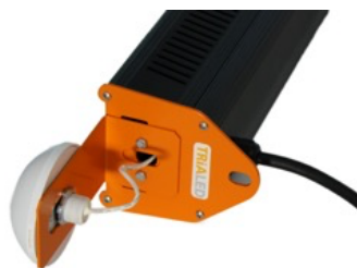
Seitenansicht mit Stromzufuhr